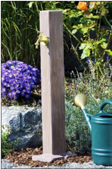
Zapfstelle in täuschend echtem Holzdekor.

Immer mehr Hausbesitzer und Hobbygärtner wünschen sich daher eine Wasserzapfstelle, die sie frei stehend an einer günstigen Stelle mitten im Garten platzieren können. Eine Standardlösung, bei der ein ver-