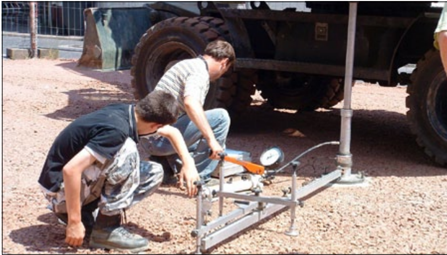
Ein Baugrundgutachten gibt Bauherren Auskunft über die Beschaffenheit des Bodens.

„In vielen Fällen wissen wir nach dieser Baugrunderkundung bereits, woran wir sind. Bei hohem Grundwasserstand