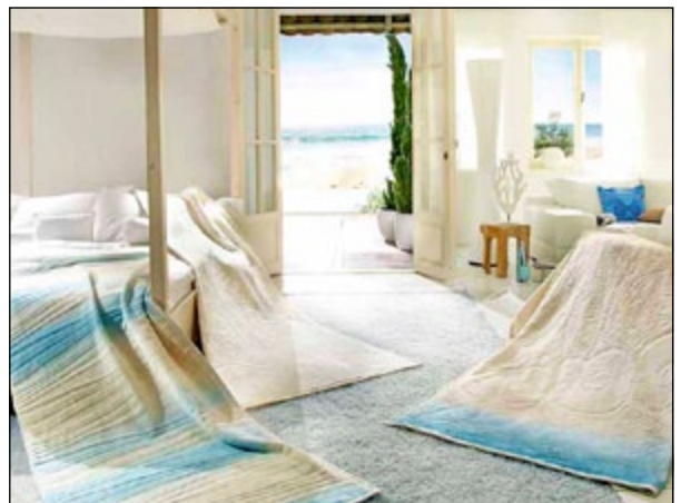
Die hochwertigen Wohndecken beeindrucken mit ihrem 3-D-Design.

Ab ans Meer! Lange Spaziergänge am Strand, Muscheln sammeln und Botschaften in den weichen Sand schreiben – so sieht ein typischer Tag an der Nord- oder Ostsee aus. Hier vergisst man schnell Kummer, Stress und Sorgen. Staunend bleibt man am Wasser stehen und beobachtet das Schauspiel der rauschenden Wellen. Der Wind lässt die Haare in der Luft tanzen und weht um die Ohren. Erholt und froher Dinge kehrt man nach Hause zurück, kuschelt sich in eine flauschige Decke und schwelgt in Erinnerungen an den erlebnisreichen Tag am Meer.